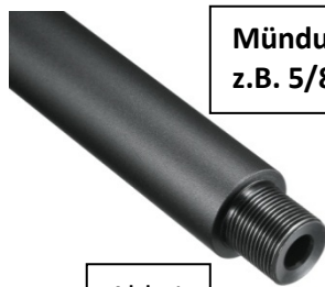
Mündungsgewinde z.B. 5/8"x 24