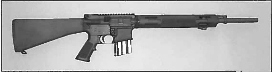
Abb. 2: Bushmaster „XM15-E2S“, Ansicht rechte Seite

Die Musterwaffe ist eine Neufertigung. Als Referenzwaffe wurde aus der BKA-Sammlung die vollautomatische Schusswaffe Colt „AR15/M16“, Kaliber 5,56mm x 45/.223 Rem., die als Kriegswaffe nach der Kriegswaffenliste eingestuft ist, verwendet.