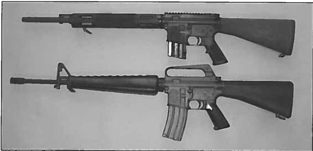
Abb. 3: oben Bushmaster „XM15-E2S“, Ansicht linke Seite, unten Referenzwaffe Colt „AR15/M16 A 1“

Die Musterwaffe ist eine Neufertigung. Als Referenzwaffe wurde aus der BKA-Sammlung die vollautomatische Schusswaffe Colt „AR15/M16“, Kaliber 5,56mm x 45/.223 Rem., die als Kriegswaffe nach der Kriegswaffenliste eingestuft ist, verwendet.