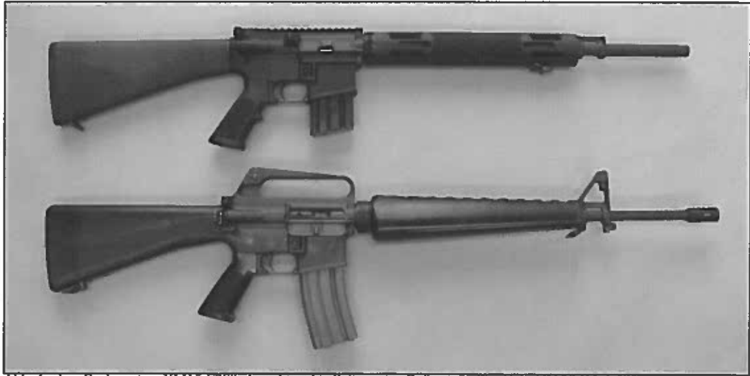
Abb. 4: oben Bushmaster „XM15-E2S“, Ansicht rechte Seite, unten Referenzwaffe „Colt AR15/M16 A 1“

Gegenüber der Referenzwaffe wurden an der Musterwaffe folgende Abweichungen bzw. Unterschiede festgestellt: