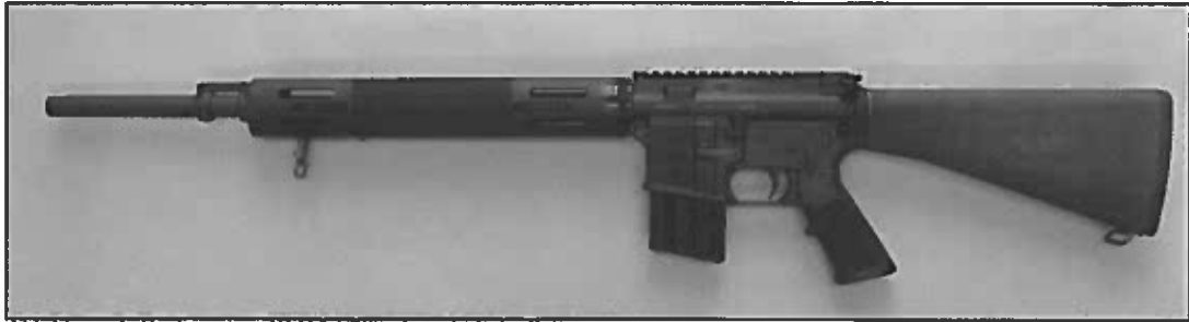
Abbildung 1: Bushmaster „XM15-E2S“, Ansicht linke Seite