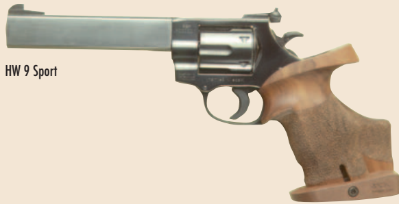
HW 9 Sport