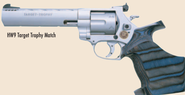
HW9 Target Trophy Match