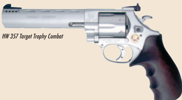
HW 357 Target Trophy Combat