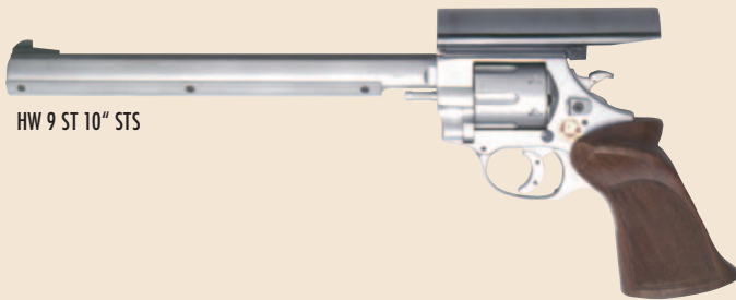
HW 9 ST 10" STS