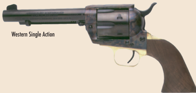
Western Single Action