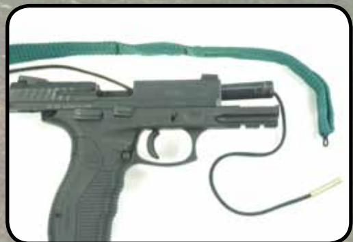
Reinigung in Schussrichtung

Verkauf nur über den Fachhandel möglich! Fragen Sie bei dem Händler Ihres Vertrauens nach diesem Angebot!